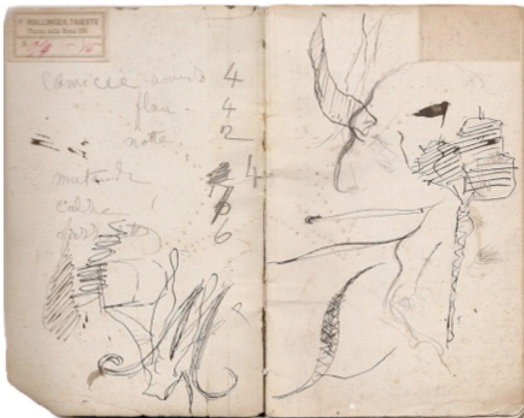
Taccuino del 1940. Roma, Archivio Rietti